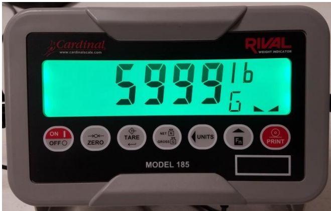
Typical Model / Modèle typique