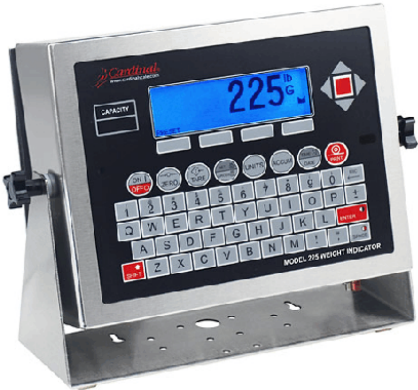
Typical Model 225 / Modèle typique 225