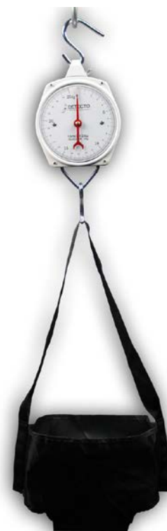
Figura No. 1