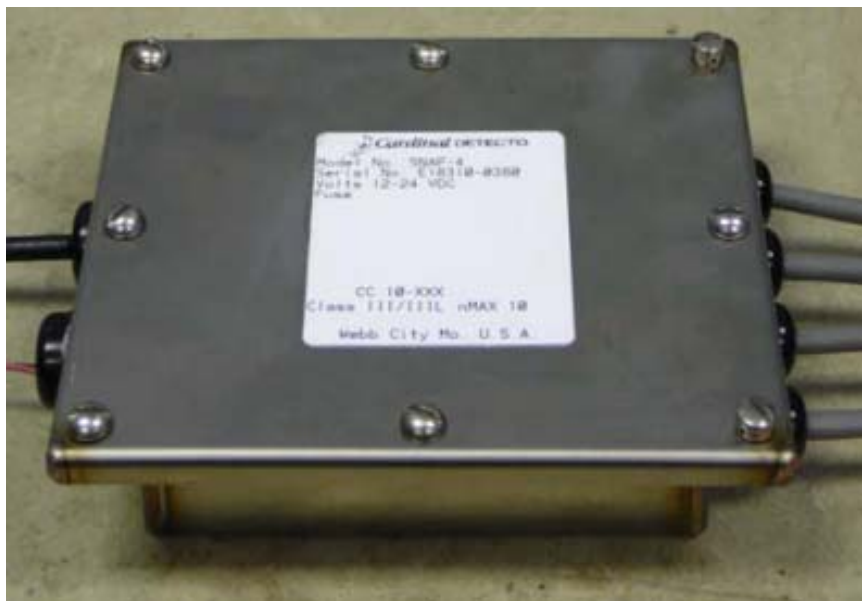
Typical model SNAP-4S or SNAP-4R A-D converter / Modèle SNAP-4S ou SNAP-4R convertisseur analogique-numérique typique