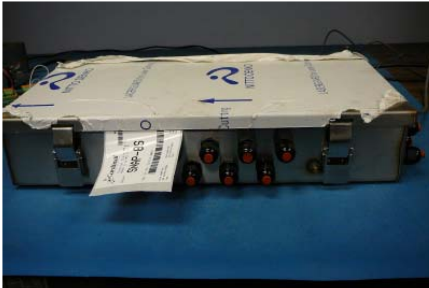
Typical junction box used to house SNAP-8S, SNAP-12S or SNAP-16S / Boîte de jonction typique pour les modèles SNAP-8S, SNAP-12S ou SNAP-16S