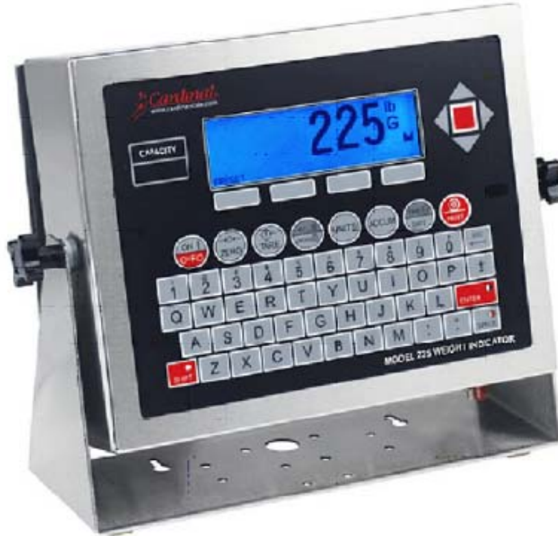
Typical model 225 / Modèle 225 typique